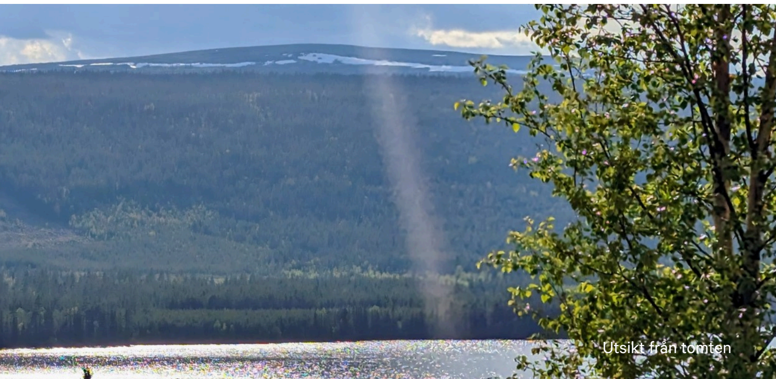
Utsikt från tomten

Klövsjöfjällen erbjuder inte bara skidåkning, här finns också golfbana, vandringsleder, vattenfall, bad, fiske och mycket mer.