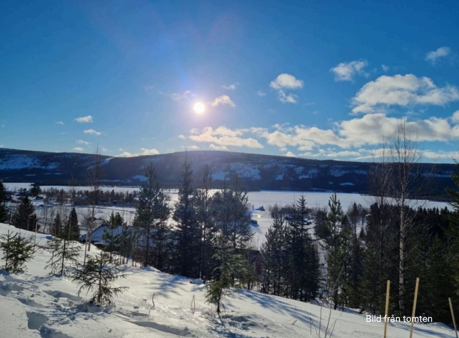
Bild från tomten