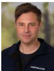
Anders Nygårds Fastighetsmäklare

Nu finns möjlighet att förvärva två sammanhängande fastigheter i natursköna Lerbäcken utanför Borlänge. Här erbjuds totalt ca 29 000 kvm mark med öppna ytor, vackra vyer och ett fritt läge i lantlig miljö. På huvudfastigheten finns äldre bostadshus och ekonomibyggnad. Byggnaderna är i mycket eftersatt skick och stort renoveringsbehov föreligger. Intill finns även separat tomtfastighet om 1 302 kvm med avloppsanläggning från 2006, vilket ger möjligheter för framtida användning. Jakträtt tillhörande 2:23 finns inom Sellnäs VVO.