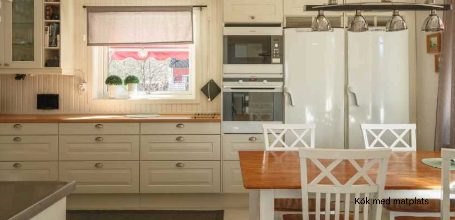
Kök med matplats

Ingår i Hjoggböle Vvo som omfattar jakt på ca 2 800 ha.