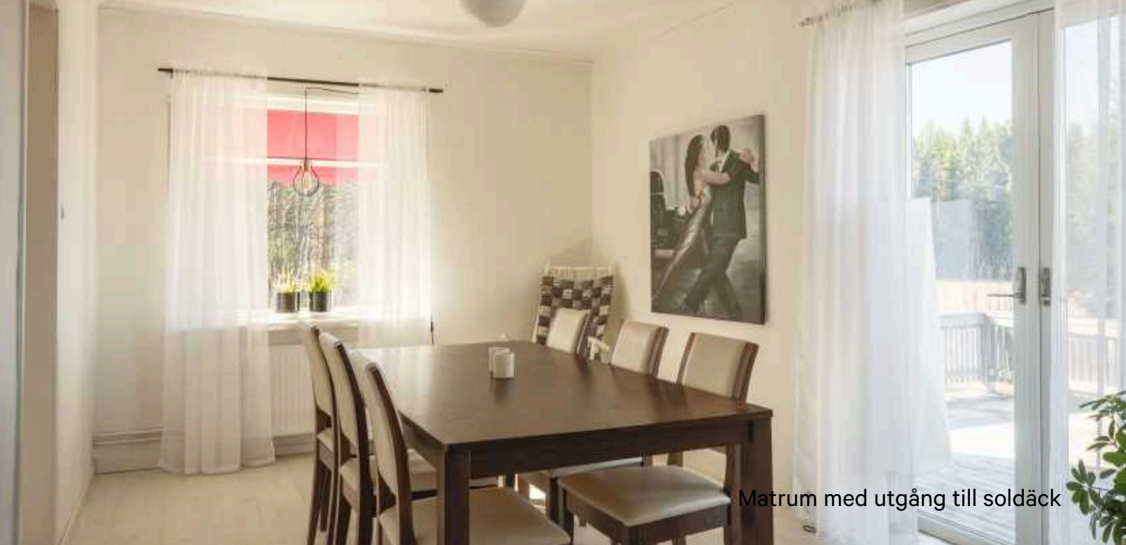
Matrum med utgång till soldäck

Bakugnarna är i dagsläget inte driftsatta och behöver kontrolleras innan användning. För att ta dem i bruk krävs brandskyddskontroll.