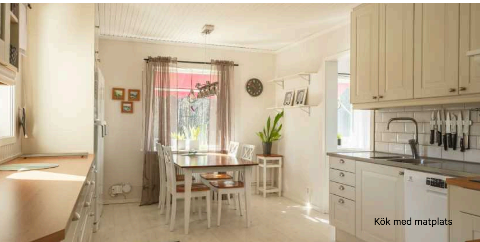
Kök med matplats

Det här är en gård med många möjligheter – perfekt för dig som söker ett lantligt boende med goda ytor för verksamhet, hobby eller mindre jordbruk.