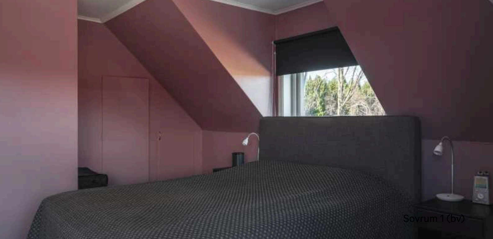
Sovrum 1 (bv)